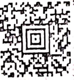
График номери 9010, аба-заман 15 мин